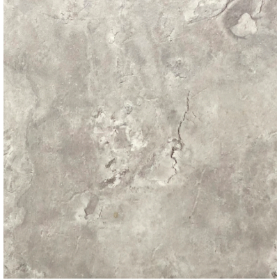
18186 FRESCO GREY