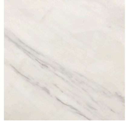
18187 BLANCO WHITE